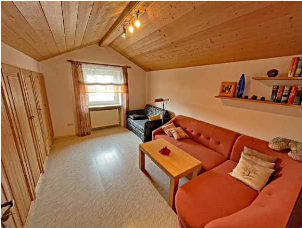
Schlafraum 2 Obergeschoss