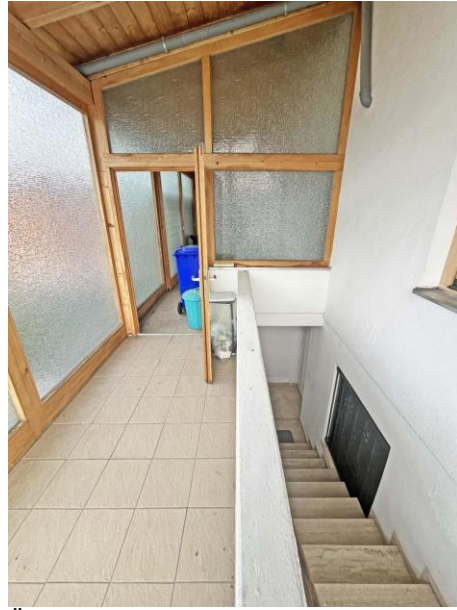
Überdachter Bereich hinter dem Haus