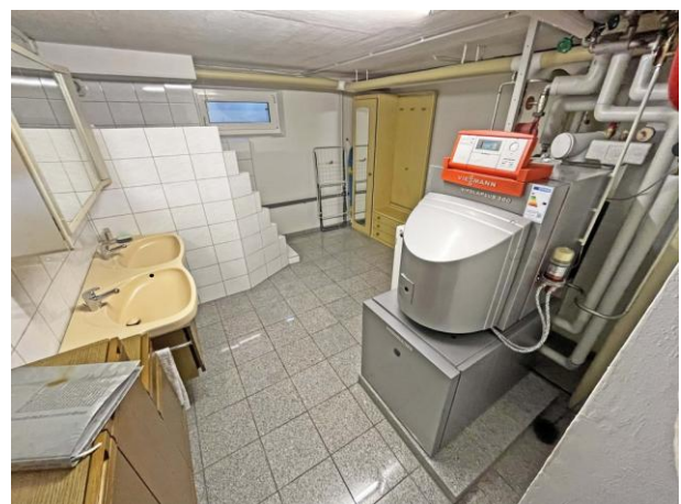
Heizraum und hinten Dusche