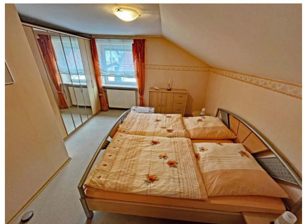
Schlafrum 1 Obergeschoss