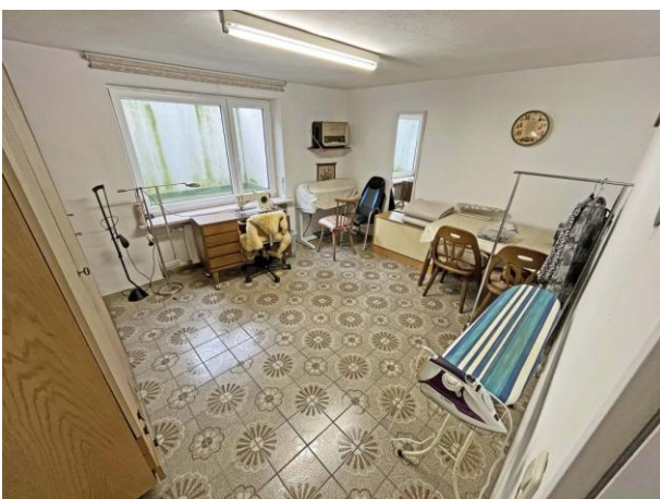
Bügelzimmer im Keller