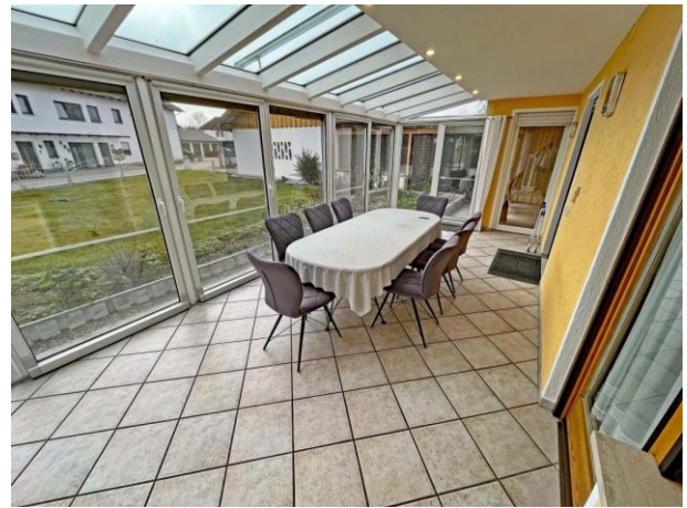
Beheizter Wintergarten mit Beschattung