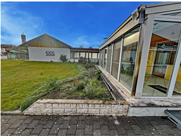
Wintergarten und vorderer Garten

Bei Kaufangeboten beträgt die vom Käufer zu zahlende Maklerprovision 3,57 % inkl. 19 % Ust. aus dem verbrieften Kaufpreis. Hinweis: Käufer und Verkäufer zahlen jeweils eine Provision in gleicher Höhe.