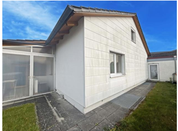
Blick auf die Rückseite