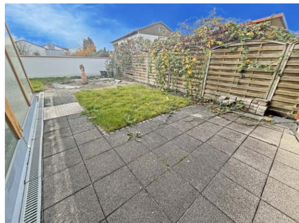
Platz hinter dem Haus - Vor Blicken geschützt