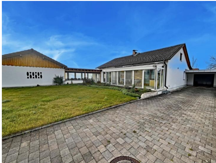
Haus mit Einzelgarage und Doppelgarage