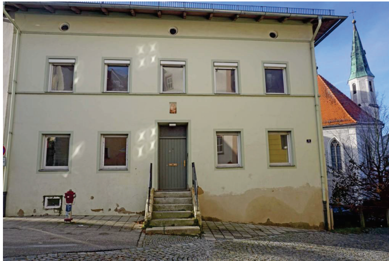
Blick auf das Haus und den Haupteingang