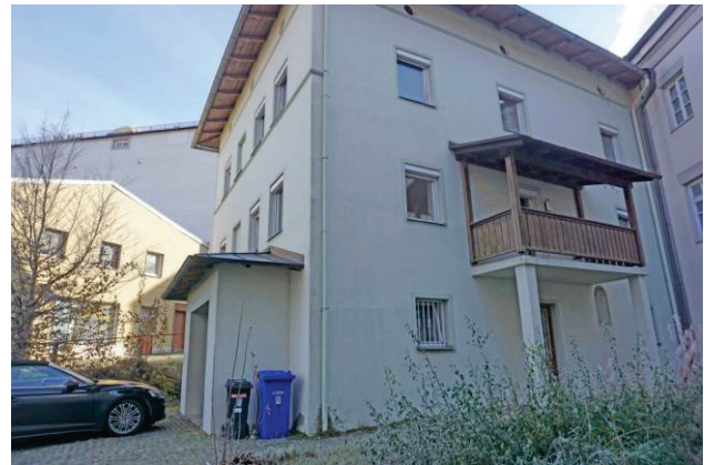
Seitlicher Eingang und Balkon