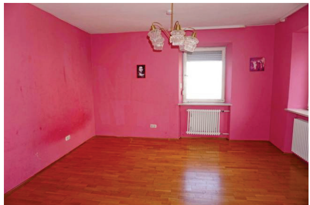
Jetzt wird es bunt - Zimmer OG