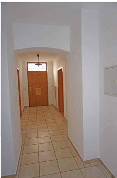
Flur EG zum Haupteingang