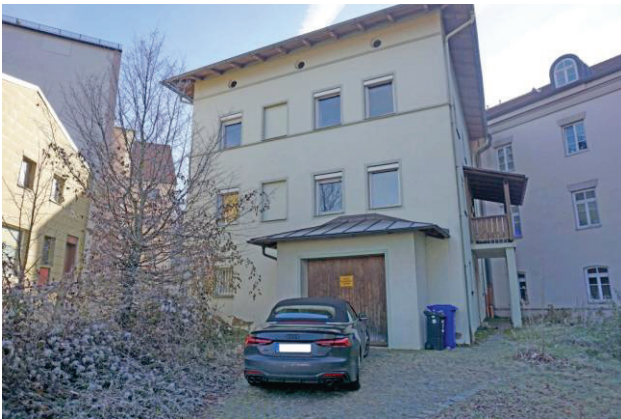
Haus und Garage

Bei Kaufangeboten beträgt die vom Käufer zu zahlende Maklerprovision 3,57 % inkl. 19 % Ust. aus dem verbrieften Kaufpreis. Hinweis: Käufer und Verkäufer zahlen jeweils eine Provision in gleicher Höhe.