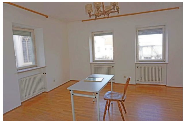
Zimmer 1 EG