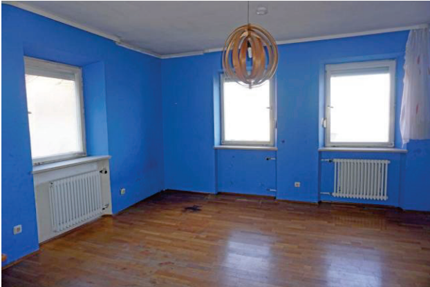
Weiteres Zimmer OG