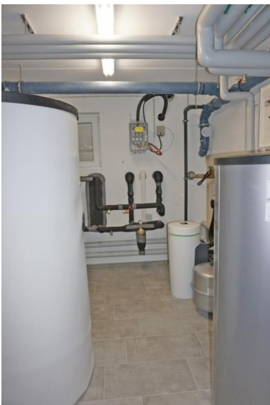
Auch ordentlich und sauber - Technikraum