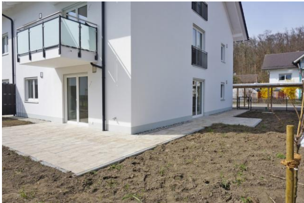
Blick vom Garten auf eine EG-Wohnung