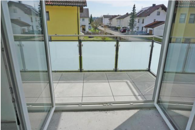
Blick vom Wohnzimmer auf den Balkon