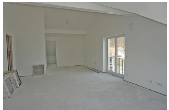
Weiteres Bild Dachgeschoss