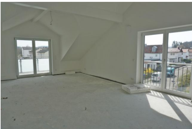
Impressionen vom Dachgeschoss