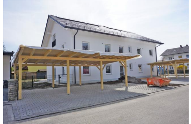
Mit Carport für jede Wohnung