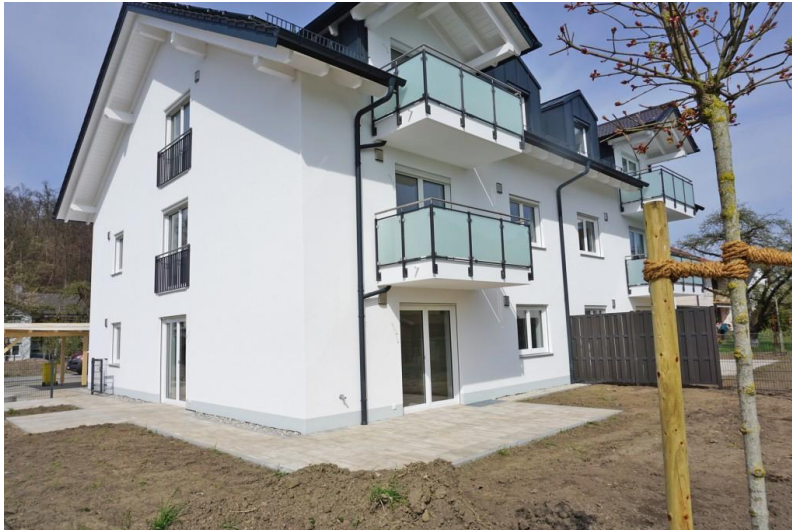
Modern und freundlich