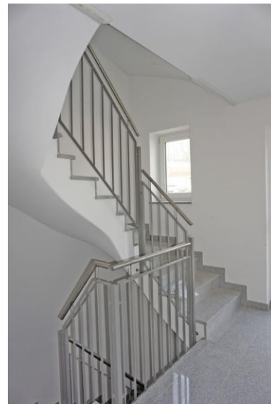
Hell und freundlich - Treppenhaus