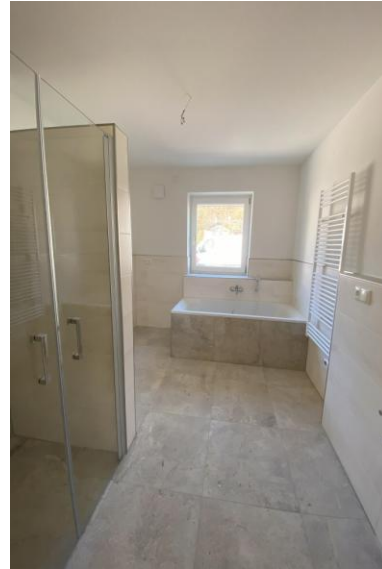
Eines der fertigen Bäder