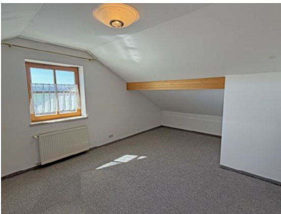
Ausgebautes Studio DG