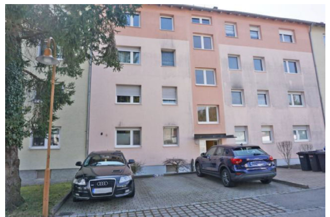
Eingangseite (Wird demnächst gereinigt)