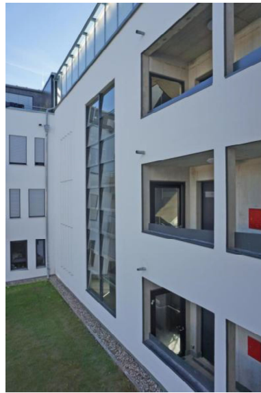
Treppenhaus mit Lift